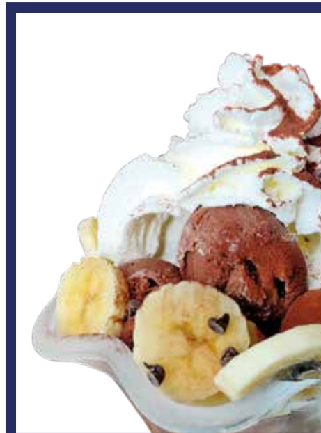
COPPA AFRICA € 9,50 gelato al cioccolato e banana, banana, panna