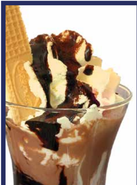
EIS KAFFEE - EIS SCHOKOLADE € 9,00 gelato alle creme, caffè o cioccolato, panna