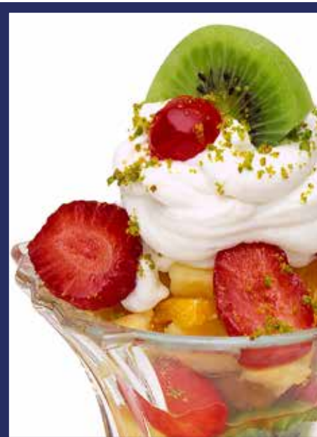
COPPA MACEDONIA € 9,50 gelato alla frutta, frutta fresca mista, panna