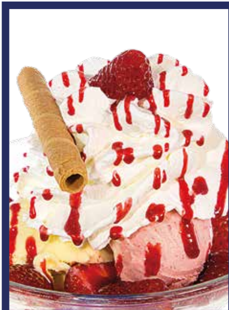
COPPA FRAGOLA € 9,50 gelato alla frutta, fragole fresche, panna