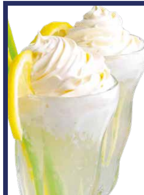
COPPA MOSKOVITA € 10,00 gelato al limone, Vodka al limone