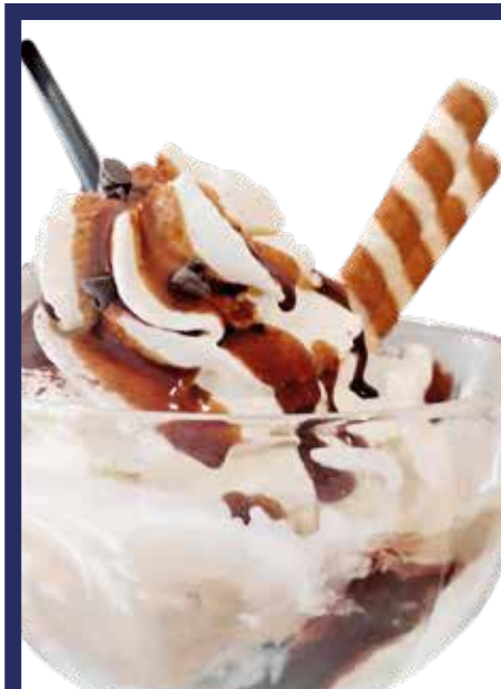
COPPA BAILEYS € 10,00 gelato fiordilatte e nocciola, Baileys, panna