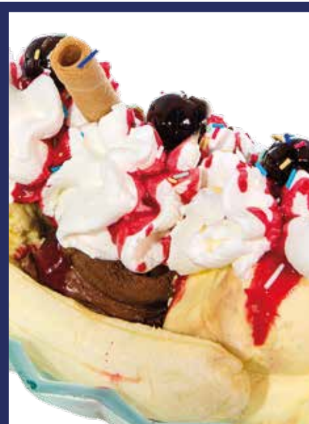
BANANA SPLIT € 9,50 gelato misto, una banana, panna